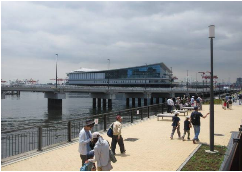
「東京国際クルーズターミナル」駅から徒歩で数分。