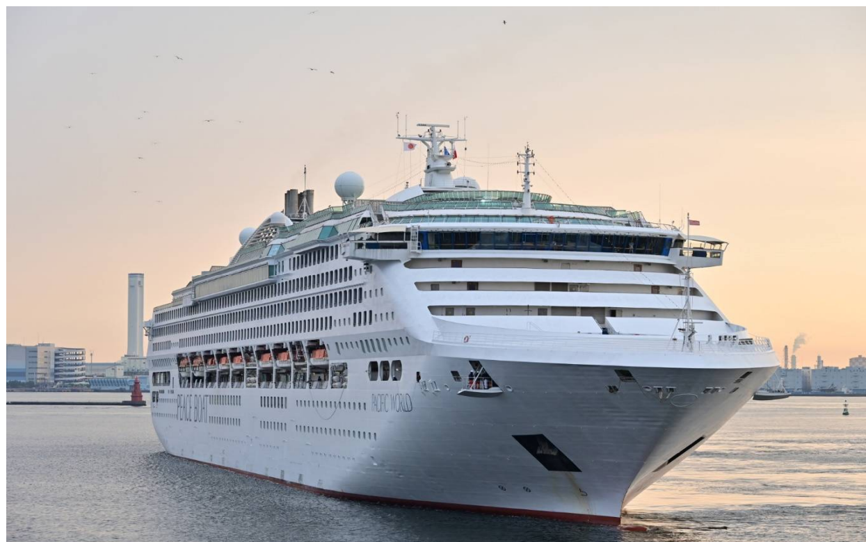
パシフィック ワールド