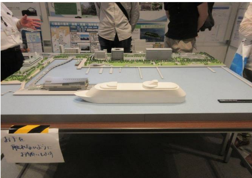
左に「船の科学館」 奥に「湾岸警察署」