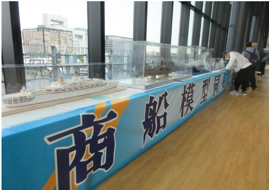
商船模型同好会の作品展示会