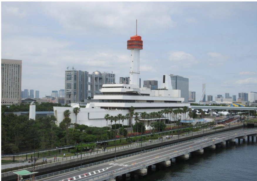
「船の科学館」(休館中)