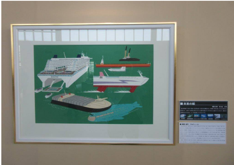
「未来の船」 (柳原良平) 船の科学館所蔵の画を展示