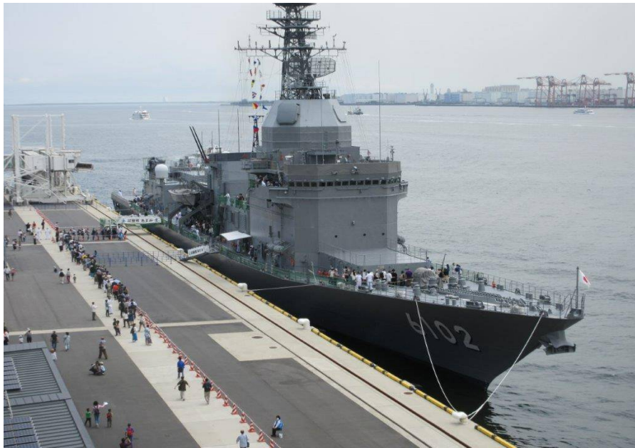
試験艦「あすか」一般公開