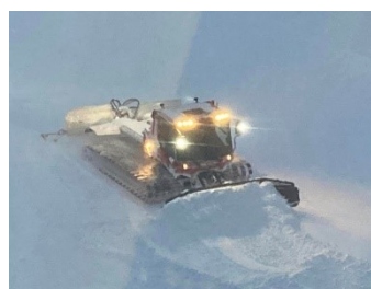
未明から活躍の圧雪車

たせいか、ラッセル車が夜間・早朝と大活躍でした。部屋からゲレンデが一望できるため、その音と光で何度か目が覚めました。