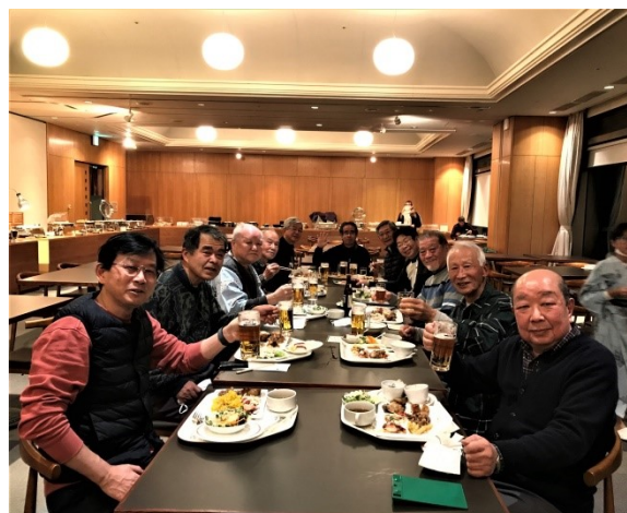
お待ちかねの宴会スタート

バイキング形式の夕食は、平日でコンディションが悪いためか外国人客が数名と若いスノーボード客ぐらいでした。