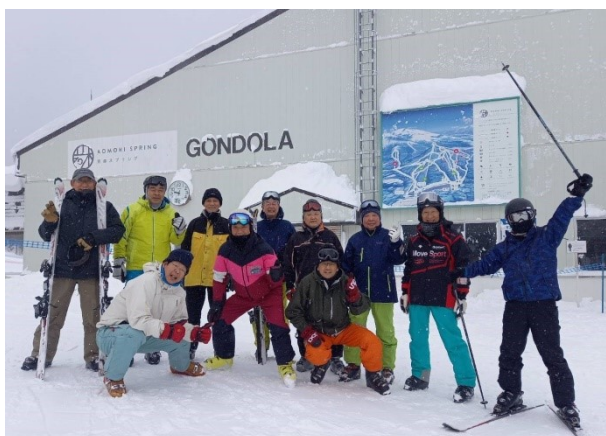
二日目の朝、吹雪が止み Gondola 前で集合写真

ゲレンデはパウダースノー。バランスを崩して転倒しても柔らかく吸収してくれるので痛みは無し。筋肉疲労も露天温泉が癒